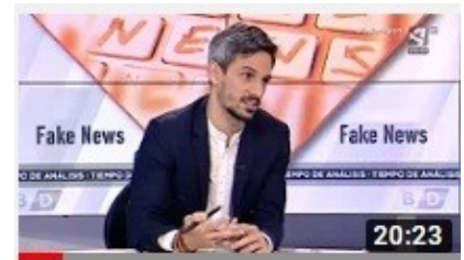
Debate sobre bulos en Internet en Aragón Televisión