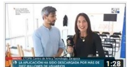
Permisos y privacidad (Aragón Televisión)