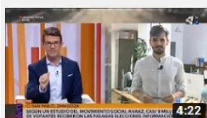
Análisis | Desinformación en campaña electoral (Aragón...