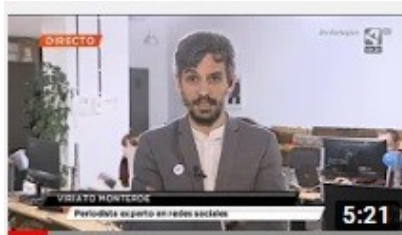
Análisis de la comunicación digital en la campaña...