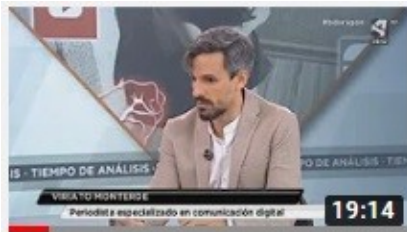
Análisis difusión de material privado en redes | Aragón TV