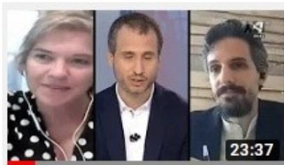
Sobreinformación (Aragón Televisión)

Colaboramos periódicamente con diferentes medios de comunicación en calidad de expertos en comunicación digital.