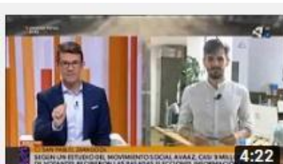
Análisis | Desinformación en campaña electoral (Aragón...)