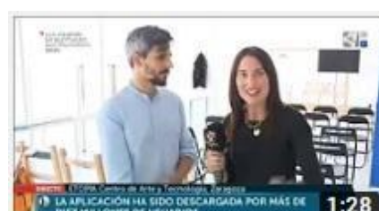
Permisos y privacidad (Aragón Televisión)