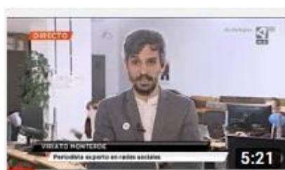
Análisis de la comunicación digital en la campaña...