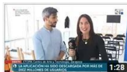
Permisos y privacidad (Aragón Televisión)