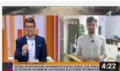
Análisis | Desinformación en campaña electoral (Aragón...)