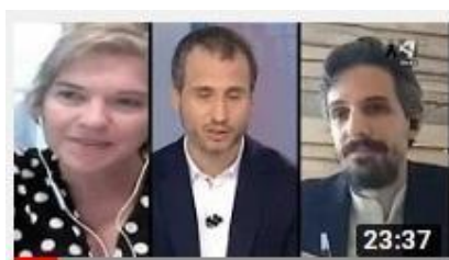
Sobreinformación (Aragón Televisión)

Colaboramos periódicamente con diferentes medios de comunicación en calidad de expertos en comunicación digital.