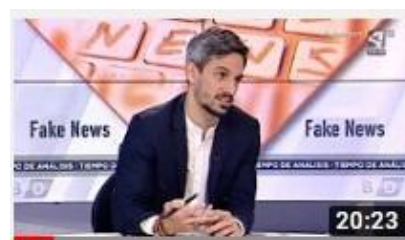
Debate sobre bulos en Internet en Aragón Televisión