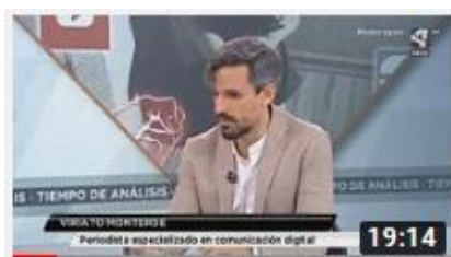
Análisis difusión de material privado en redes | Aragón TV